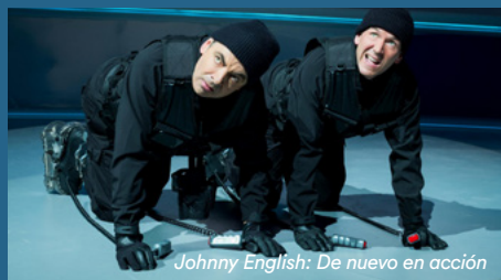
Johnny English: De nuevo en acción