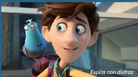
Espías con disfraz