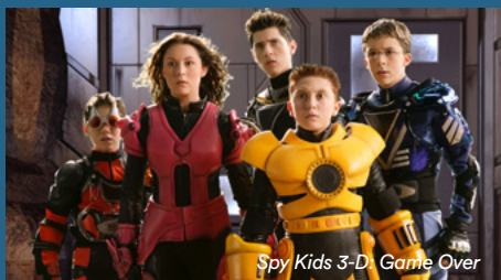
Spy Kids 3-D: Game Over

En el arte del espionaje, además de misterio, también hay mucho suspense (aquella sensación de incertidumbre sobre lo que ocurrirá que nos mantiene en estado de tensión). Hacerse pasar por alguien u obtener información sin ser descubierto no es nada fácil, pero con los siguientes trucos ¡tú también podrás convertirte en espía por un día!