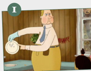
«Platos sucios y dieta deficiente»