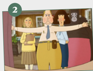
«No hay cama»