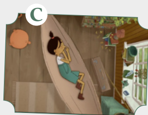
Una habitación propia