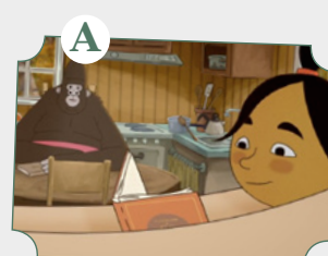
Espacio de lectura