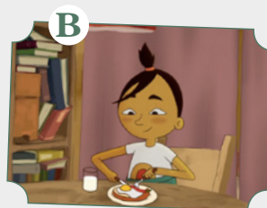
Comida nutritiva y vegetariana