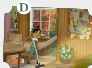
Hábitos de limpieza