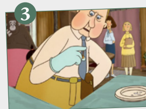
«Pegajoso, sucio y asqueroso»