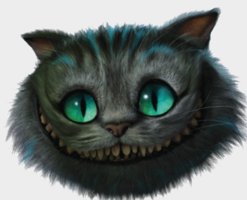
2 EL GAT CHESSUR (2010) de l'adaptació cinematogràfica d' Alicia al país de les meravelles dirigida per Tim Burton