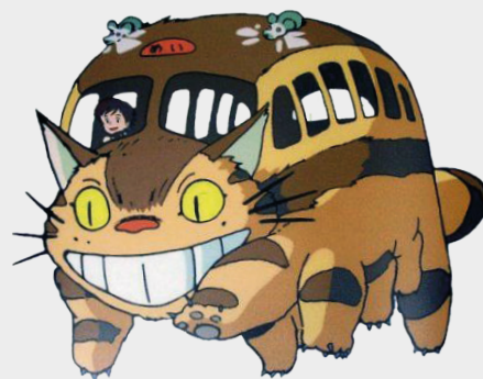
3 EL NEKOBASU O EL GAT-BUS (1988) d' El meu veí Totoro

Quins elements del gat-bus recorden un autobús i quins un gat? Inventa un altre animal-objecte i dibuixa'l.