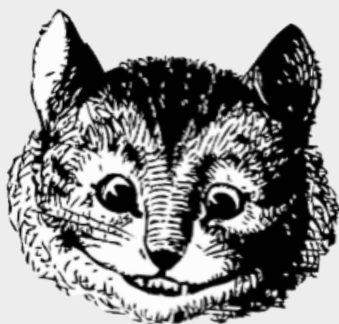
1 GAT ORIGINAL (1865) dibuixat per John Tenniel

Segons el folklore japonès, els gats que ja són grans tenen poders màgics que els permeten canviar de forma. El «gat-bus» és un gat que va veure un autobús i, encuriosit, va decidir transformar-se en aquest mitjà de transport. La cara del gat-bus està inspirada en el gat d' Alicia al país de les meravelles , de Lewis Carroll.