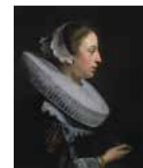
Autor desconegut Cercle de Thomas de Keyser (Amsterdam, cap al 1596/1597-1667) Retrat de dona amb gorgeri, 1630-1635 Oli sobre taula Legs Gustave Revilliod, Genève, 1890.