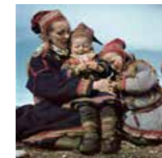
Robert Capa, Família lapona , Noruega, 1951.

Espai 3 | 11-14 h i 15.30-19.30 h | Per a tota la família Taller de creació amb la María López i Javier de Riba, un tàndem artístic que experimenta amb murals de gran format. A partir d'una instal·lació de plafons fotoluminescents podrem dibuixar amb la llum.